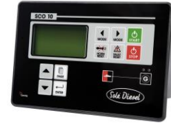
Tableau SCO 10