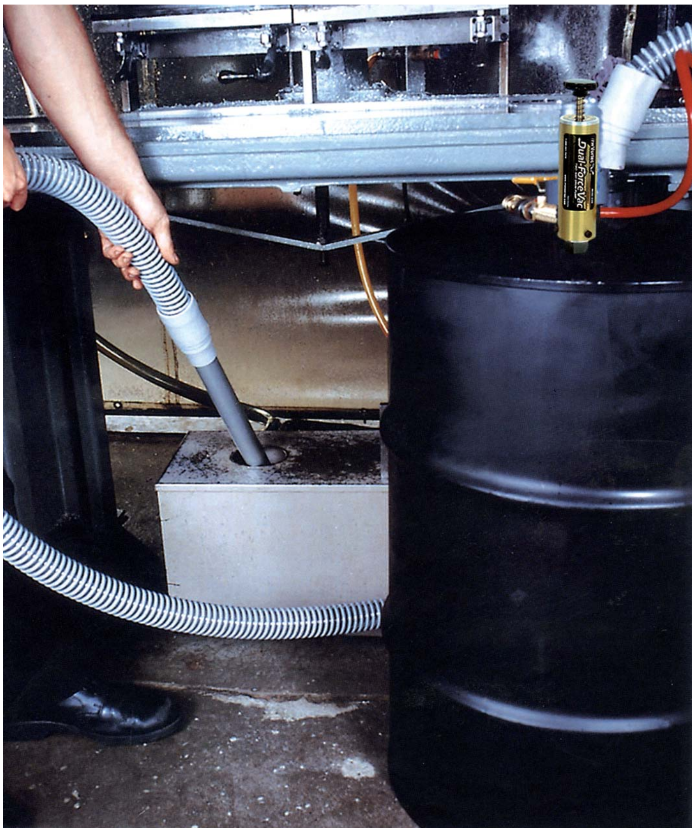
La pompe de fûts 2109 permet de capter les liquides avec un débit de 170 l/min.