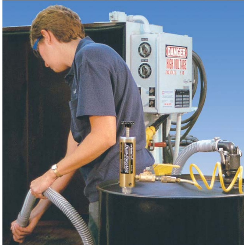
Aspiration d'huile ou de lubrifiant sur une machine avec la pompe de fûts réversible 2109.

Le débit de vidange peut atteindre 171 l/mn (pour de l'eau).